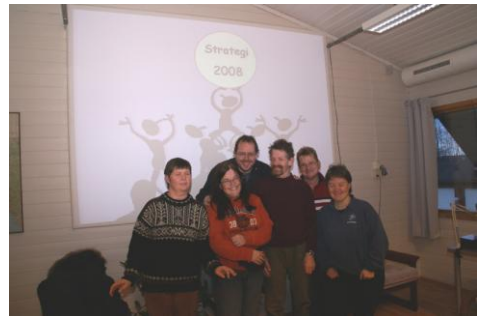
Gjengen samlet på seminar.

Vi har hatt møter og seminar sammen med BBL. BBL står for BroBygger-Ligaen. BBL er en frivillig interesse organisasjon, som ble startet våren 2007.