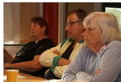
Tema-kveld - omsorgsmeldingen

Vi opplever at vi har blitt hørt i denne saken.