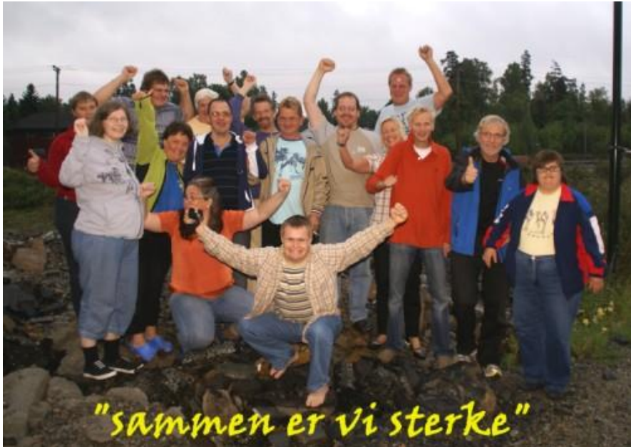
"sammen er vi sterke" Gjengen som skal arrangere "Stemme-høring" høsten 2009