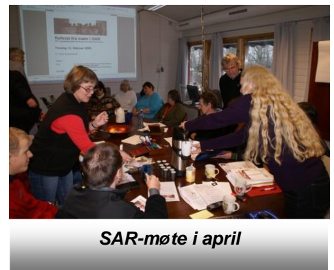
SAR-møte i april

Vi har begynt å jobbe med en sak som handler om ferie for alle. Hvordan kan vi samarbeide for at flere skal få reise på ferie dit de ønsker og sammen med hvem de ønsker?