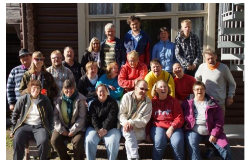
Felles-bilde fra SAR-møte

Vi har fortsatt å jobbe med saken ”Ferie for alle”. Hvordan kan vi samarbeide for at flere skal få reise på ferie dit de ønsker og sammen med hvem de ønsker? Kan det lages et reise-byrå?