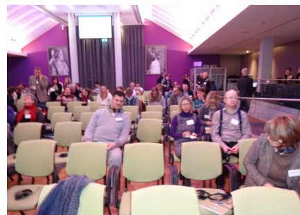
Markering av FN-dagen