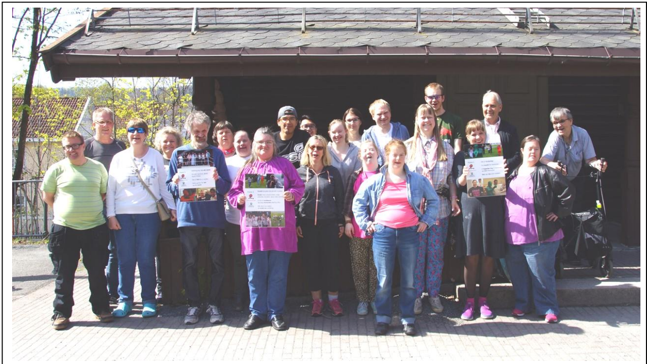
Deltakere på SAR-møte i mai 2018

Rådgivningsgruppen for utviklingshemmede i Bærum kommune