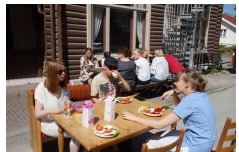
Brukerrådstreff i Sandvika