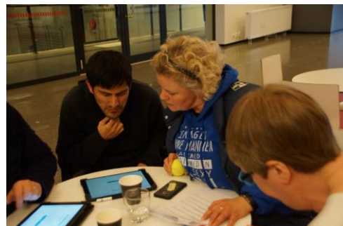
Temakveld «Sjef i eget hus»

Gruppen har jobbet med 9 nye saker og fulgt opp 5 tidligere saker.