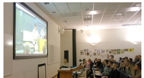
Gro foreleser for studenter