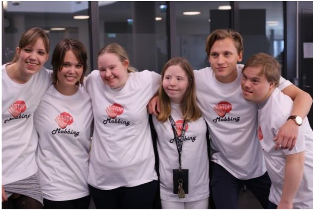
Ivrige deltakerer på mobbe-konferansen 9. mars 2016

Rådgivningsgruppen for utviklingshemmede i Bærum kommune