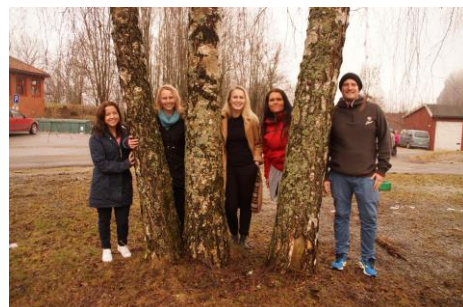
Studenter i praksis

09/15 Ny brosjyre Vi må oppdatere brosjyren vår. Har begynt på arbeidet Og regner med å bli ferdige i 2016.