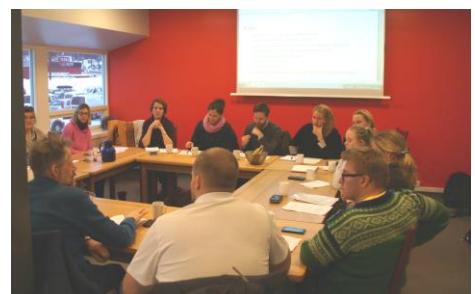
Besøk av rettighetsutvalget

Gruppen har jobbet med 10 nye saker og fulgt opp 3 tidligere saker.