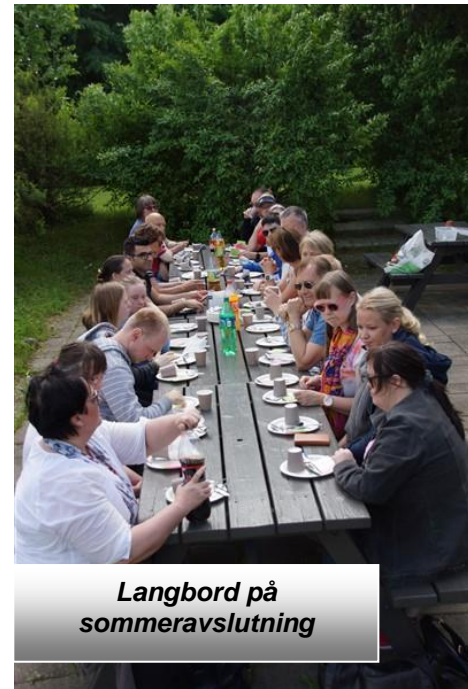
Langbord på sommeravslutning

5. desember var det jule-avslutning hos Cora i Lippestadveien med julemat.