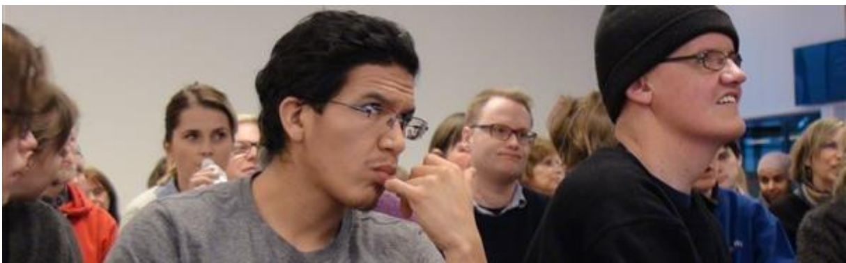
Høring «På lik linje» 9. februar 2017