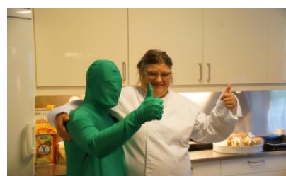
Arbeid med bilder til mobbe-plakater juli 2017

12/17 Forelesning for studenter Vi har holdt tre forelesninger for vernepleierstudenter.